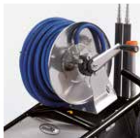
The S.S. hose reel can be mounted on request, with 20, 40, 60 m hose