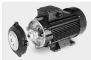
Motor-pump coupling with a flexible joint