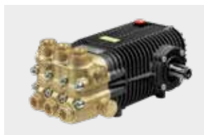
SW / TW Premium